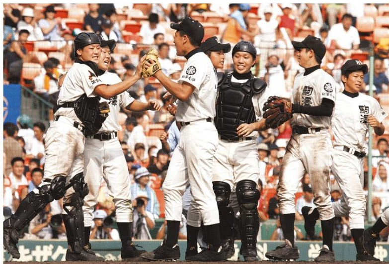
【17日・準々決勝】鳴門工を大逆転しベスト4進出を決めて喜び合う駒大苫小牧ナイン